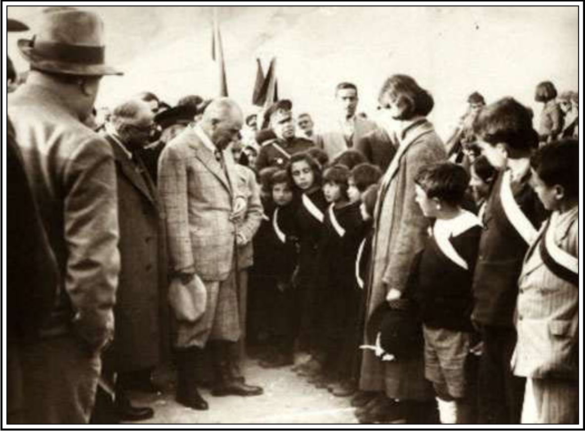
Cumhurbaşkanı Mustafa Kemal Atatürk, Pertek’te Öğrencilerle Konuşurken(17 Kasım 1937)

Eğitim alanında, temel ilke eğitimi birleştirme ve bütünleştirme ilkesidir. Bu nedenle bir yandan Müslüman halkın eğitim kurumlarındaki ikilik ortadan kaldırmak için diğeri yandan da Müslüman yada olmayan halkın ilk eğitiminin devletin yetki alanı içine alınarak, ulusal bir eğitim kavramı oluşmuştur 23 .