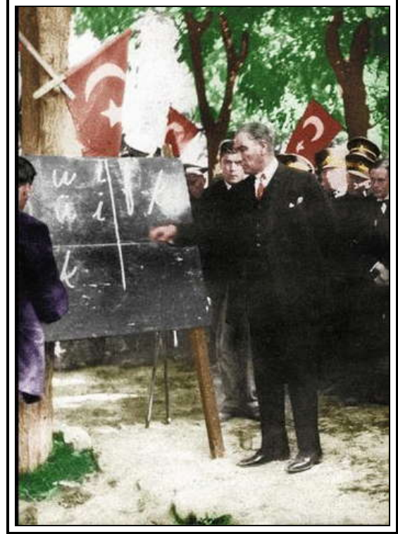
Cumhurbaşkanı Gazi Mustafa Kemal, yeni Türk harflerini halka bizzat öğretirken (20 Eylül 1928)

1932 yılında kültür ve eğitim kurumları olarak Halkevleri faaliyete geçmiştir. Ülkede bulunan tek üniversite olan Darül Fünun’da 1933 yılında İstanbul Üniversitesi olarak düzenlenmiş ve daha sonra her gün sayıları artan diğer üniversitelerle eğitim ve öğretim alanında çabalar devam etmiştir 20 .