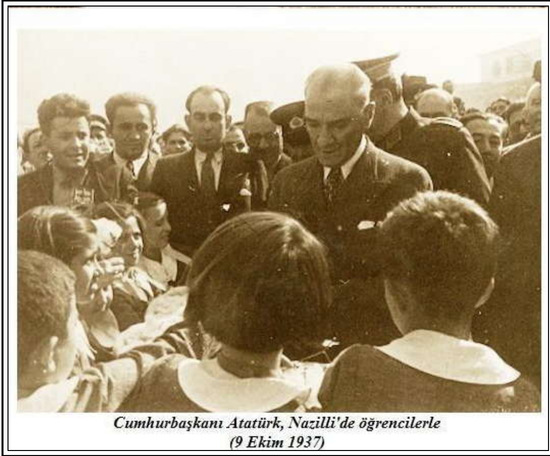
Cumhurbaşkanı Atatürk, Nazilli'de öğrencilerle (9 Ekim 1937)

Ankara'da Maarif Kongresi'nin Kurtuluş Savaşının Kütahya-Eskişehir çarpışmalarının zor günlerinde toplanmış olması, Mustafa Kemal'in zafere inancının tam olduğunun göstergesidir 11 .